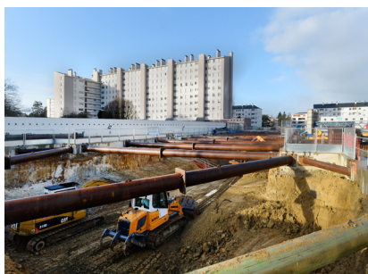
Station Les Gayeulles - Février 2016

N'hésitez pas à contacter la Semtcar pour toute question en lien avec le chantier.